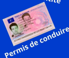
Permis de conduire

Mais aussi : - Permis de chasse - Carte d'invalidité - Carte de fonctionnaire